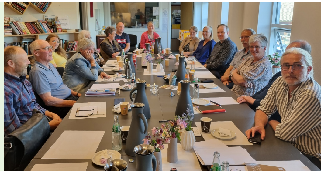
Fra dialogmødet i Givskud Hallens lokaler