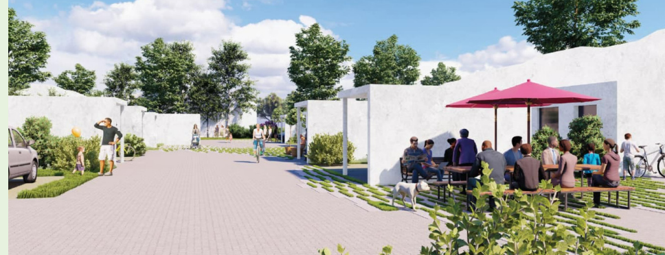
Ill.: Boligselskabet Sct. Jørgen

Derfor er det vigtigt at nævne, at bofællesskaber ikke kun er for seniorer. I stedet bør man se muligheder i at etablere fællesskaber, der er fleksible - både i forhold til beboersammensætning og i forhold til bebyggelsens og boligernes fleksibilitet, så de kan tilpasse sig ændrede behov over tid. En ny boligbebyggelse, Skalmaparken, i Skals er et godt eksempel til inspiration for andre landsbyer.